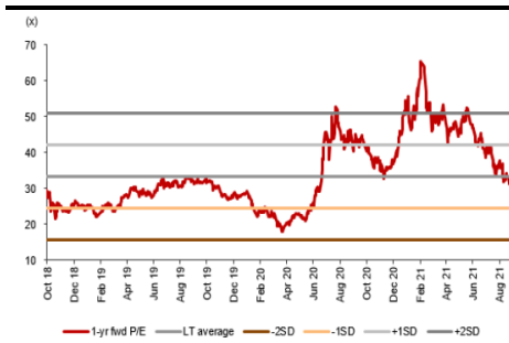
中免之 12 個月遠期市盈率