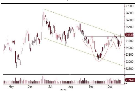
恒生指数突破“头肩底”