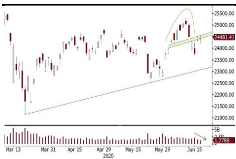
恒指反彈但成交縮減