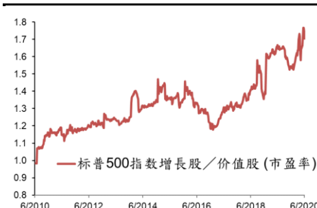
美國增長股對價值股之溢價擴闊