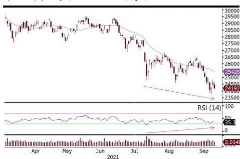
恒生指數與RSI三底背馳