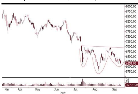
恒生科技指數或正營造頭肩底