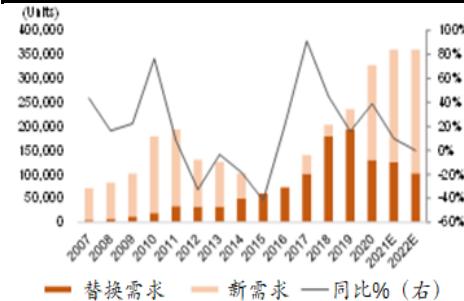
中国挖掘机销量预测