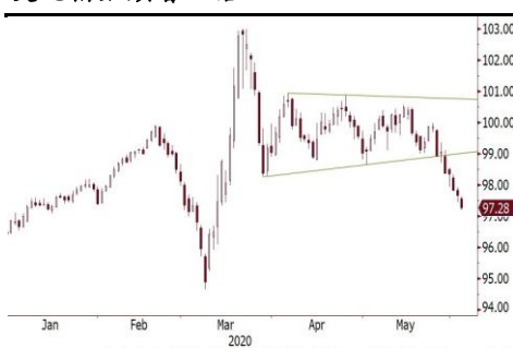
美元指數顯著回落