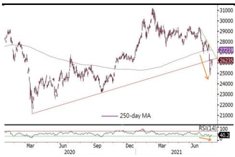
恒生指数未重返升轨之上

■ 汇丰派息逊预期；水泥机械股急弹。 恒指于7月份急跌9.9%后，8月首个交易日升275点或1.06%，重上26,000之上，科技指数升0.23%。大市成交跌至1,658亿港元。 汇丰(5 HK) 昨天中午公布第二季业绩，股价于上午升逾3%，但派息逊市场预期，收市股价仅升0.9%，而其股价于伦敦更先升后跌，折合较本港低1.7%。新能源相关股份维持强势， 比亚迪(1211 HK) 涨8%， 福莱特玻璃(6865 HK) 升15%。内地推动煤炭供应增加，水泥股憧憬煤价回落， 海螺水泥(914 HK) 升8%。机械设备股亦急升， 中联重科(1157 HK) 和 潍柴动力(2338 HK) 涨逾13%。图表上，恒指和科技指数近天几超卖反弹，但未收复支持位，未确认回稳，估计短期内维持反复，恒指短期反弹阻力于上升轨约26,500。