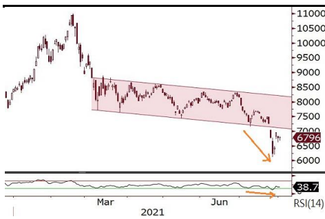
恒生科技指数未重返通道内