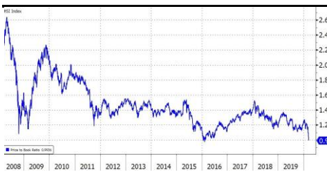
恒指市帐率 (2008-2020 年)