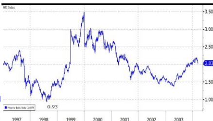
恒指市帐率 (1997-2003 年)