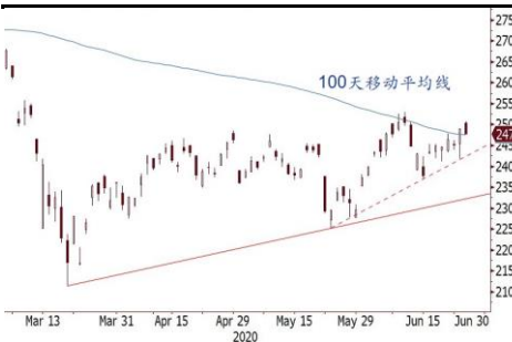
恒指 100 天綫爭持