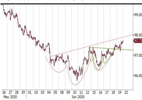
美元轉強反映避險情緒回升