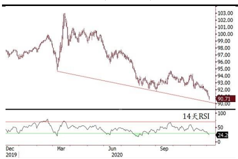
美元指数跌穿 91，创两年半新低