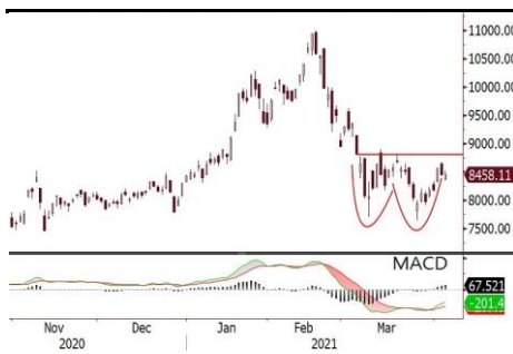
恒生科技指數營造小雙底