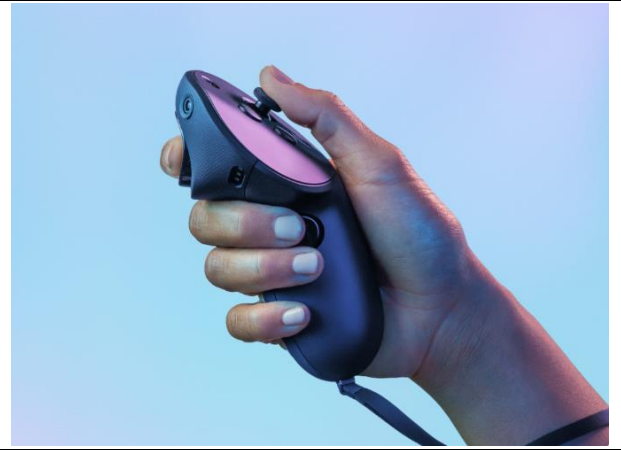
图 2: Meta Quest Touch Pro 控制器