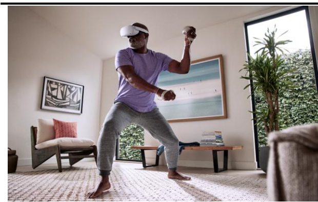
图 6: Meta Quest Pro: 健身