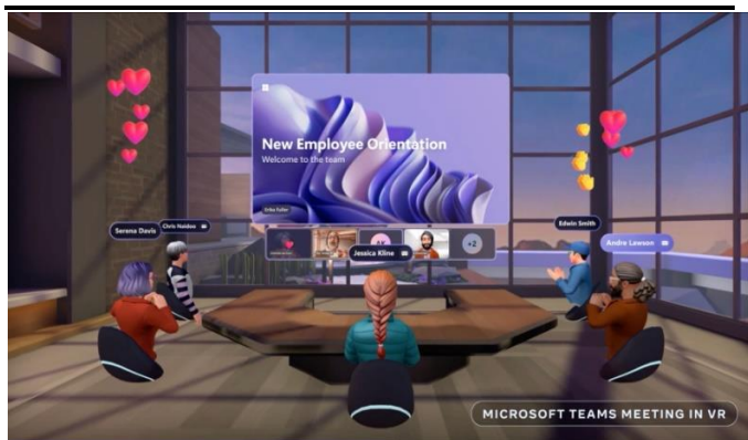
图 5: VR 场景内的 Microsoft Teams 会议