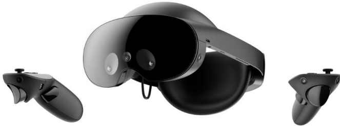
图 1: Meta Quest Pro

Meta 在 Meta Connect 2022 推出公司首款高端 VR 头显 Meta Quest Pro。新的 VR 头显将于 10 月 25 日开始发货，售价为 1,499.99 美元。Meta Quest Pro 多项新功能有望提升 VR 体验：1) Pancake 模组大幅降低光学模块厚度与重量，让头显佩戴体验更加舒适；2) 高分辨率传感器和全彩透视支持更强大的混合现实（MR）体验；3) 眼动追踪和面部追踪改善社交体验等；4) 新的 Qualcomm Snapdragon XR2+ 处理器的性能显著优于 Meta Quest 2 的处理器；5) 每英寸像素较 Meta Quest 2 增加 37%，提供更清晰的视觉影像。我们预计 VR 硬件的提升将助力 VR 内容生态系统的发展，有利于 VR 内容开发商，尤其是重度游戏研发商与办公协同服务提供商，主因其所提供的内容与服务需要高沉浸感的 VR 体验。