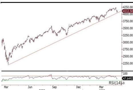
美国标普500指数接近疫情后之上升轨