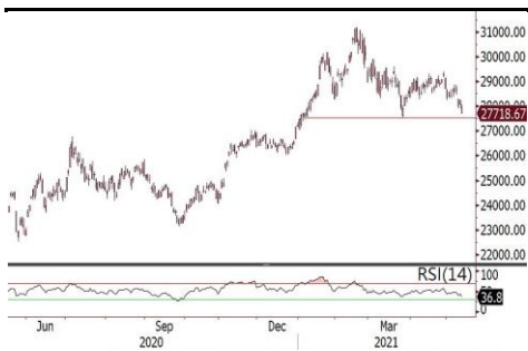
恒指短期支持于3月份低位27,500