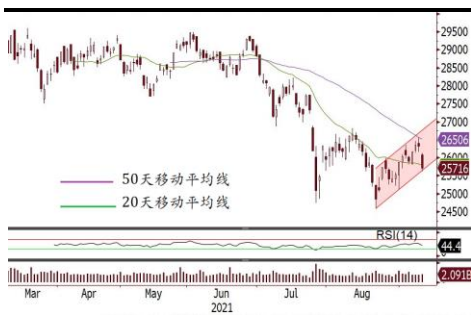
恒指受制50天線後回落