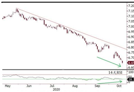
在岸人民幣兌美元超買