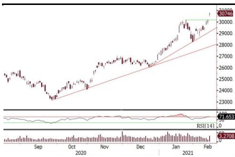
恒生指数创今年新高