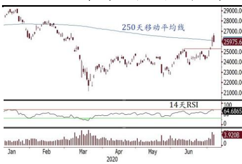
恒指超買整固，料 6 月份高位有支持