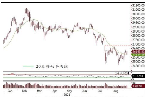
恒指短期上試 8 月中高位 26,822

■ 恒指技術走勢改善，短期上試 26,822。 港股昨天低開高收，恒指低開 74 點，其後受 A 股走高帶動，恒指收市升 262 點或 1.01%，科技指數升 0.74%。大市成交縮至 1,463 億港元。 騰訊(700 HK) 升 3.5%，重上 500 元以上。汽車股急漲， 比亞迪(1211 HK) 公布上月銷量後，股價升 7.8%， 廣汽(2238 HK) 亦漲 7.2%。電力股獲利回吐， 華潤電力(836 HK) 曾飆升逾一成但收市倒跌 1.5%。昨夜美國假期休市，今晚復市，歐洲三大指數升 0.80%-0.96%，因美國上周五公布的就業數據疲弱紓緩央行收水的憂慮。圖表上，恒指連續四天企於近月重要阻力 20 天移動平均線上，同時 14 天 RSI 升穿 50，短線有望延續反彈走勢，上試 8 月中反彈高位 26,822。資金流向方面，港股通南向合計經過連續 8 天淨賣出後，昨天錄得淨買入約 21 億港元，而過去一個月累計淨賣出約 200 億港元。