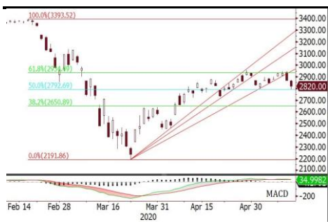
標普 500 指數跌穿扇形