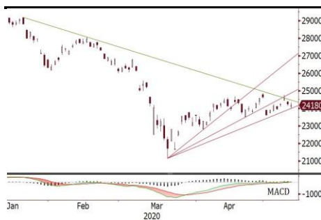
恒生指數今天或跌穿扇形