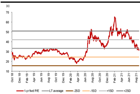
中免之 12 个月远期市盈率