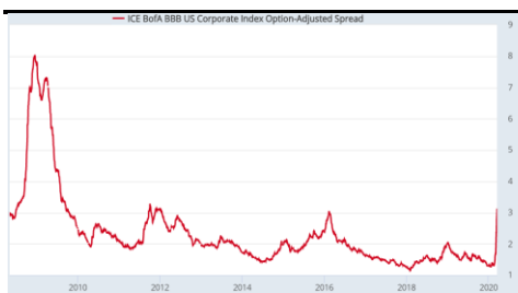
美國 BBB 評級企業債孳息差

■ 從孳息差觀察美國企業違約風險。 新冠肺炎疫情全球大流行，市場除了憂慮環球經濟將陷入衰退，亦擔心受重創的行業如航空、旅遊等將出現債務違約潮，並從而令銀行壞帳飆升甚至演變成金融危機。因此，投資者將密切注視企業債券的孳息差，以衡量企業違約風險。美國BBB（投資評級）企業債及高息企業債之孳息差，最新升至2011年及2016年之高位，若果孳息差再大幅上升，將反映市場對上述憂慮加深，則美股以至環球股市將續有沽壓。這視乎各國政府能否控制疫情、貨幣及財政政策能否到位等因素。