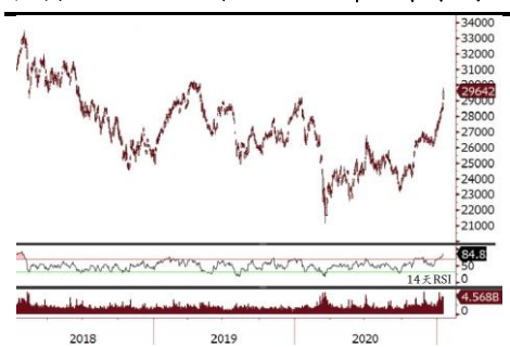
恒指 14 天 RSI 升至 2018 年以來最高