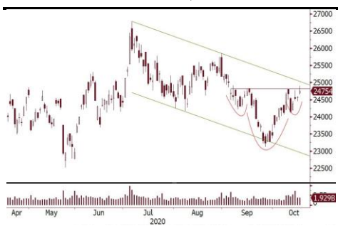
恒生指数酝酿突破头肩底