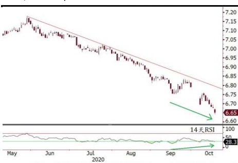
在岸人民币兑美元超买