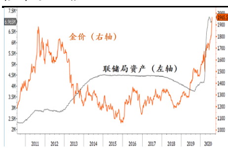
金價升越2011年高位，期間聯儲局資產升近1.5倍