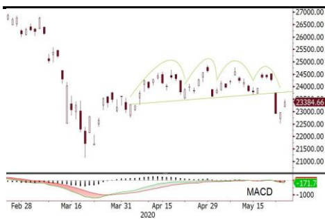
恒指短期反彈阻力於 23,500-23,700